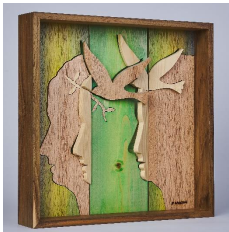
In foto: da sinistra, le sculture Sonata al chiaro di luna e Primavera

Il presente comunicato è disponibile anche sul sito web: