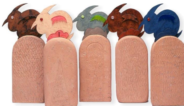
Sandro Visca, Prima del volo , 1994. Terracotta, materiali rigenerati e metacrilato, 70x39x6 cm